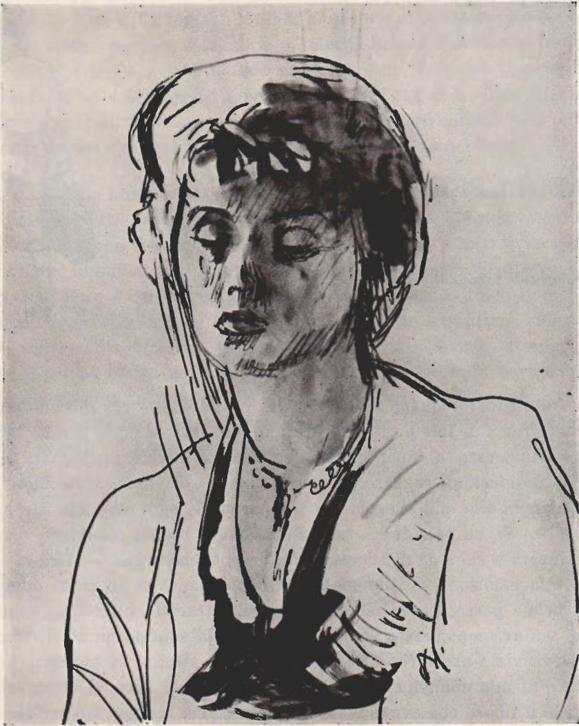
R. Tubaro: Ritratto di giovane donna.